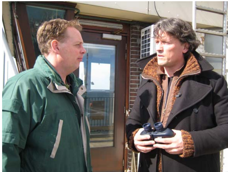
Het Waddengebied: onderzoek en lokale participatie