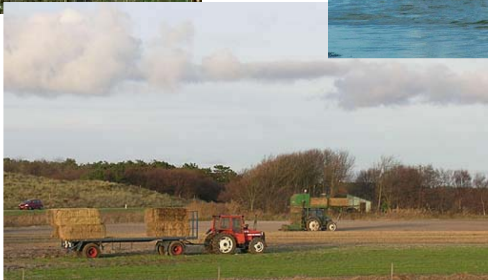
Het Waddengebied als cultuurlandschap