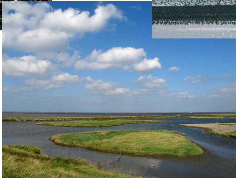
De Wadden als natuurgebied